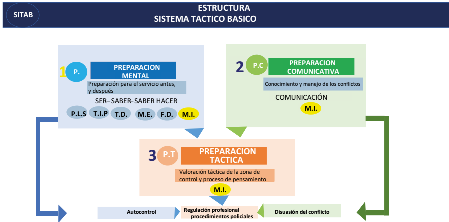
Figura. 2. Estructura sistema táctico básico

Nota. Sistema táctico básico policial (2018), convenio de cooperación policía del Reino Unido de Suecia.