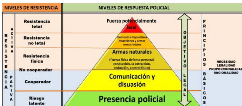
Figura 3. Modelo Empleo de la fuerza

Nota. La imagen muestra los niveles de respuesta policial de acuerdo a los niveles de resistencia.