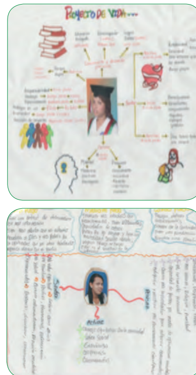
Figura 5. Composición de las diagramaciones de los proyectos de vida de los estudiantes de primer semestre 2012-2 del programa académico de Trabajo Social en la asignatura de Epistemología de las Ciencias Sociales y Humanas (un después).

La resiliencia un proceso donde el individuo desde el autorreconocimiento de sus potencialidades puede dar un salto a la adversidad y gestar su propio modelo de desarrollo individual y social