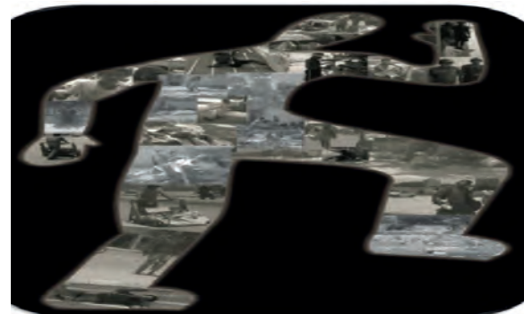
Figura 3. Trabajo de campo desarrollado por estudiantes de primer semestre del programa académico de Trabajo Social sobre la indigencia en las calles de Barranquilla, 2010

En la configuración de la figura humana se observa una composición sobre la problemática de la indigencia que se vive diariamente por las calles de la ciudad de Barranquilla; este trabajo de campo desarrollado por estudiantes de primer semestre reveló la actitud disciplinada, la curiosidad, la capacidad imaginativa, el detalle de los hechos, el aventurarse a recorrer las calles de la ciudad para focalizar los lugares donde se hacía evidente la problemática. Es un acto de aprendizaje donde se muestra la escala valorativa que subyace en el proyecto de vida del estudiante en la búsqueda del conocimiento y de su profesionalización.