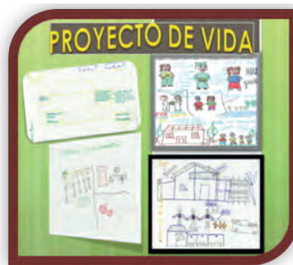
Figura 4. Representaciones de las diagramaciones de los proyectos de vida de los estudiantes de primer semestre 2012-2 del programa académico de Trabajo Social en la asignatura de Epistemología de las Ciencias Sociales y Humanas (un antes)

El capitalismo requiere de una masa enorme de sujetos consumistas, individualistas, competidores, vanidosos y pragmáticos que centren su existencia en lo inmediato y se integren al proyecto socialmente exaltado de trabajar para consumir y consumir para trabajar. Sujetos incapaces de reflexionar su propia práctica y de pensar su existencia como una existencia posible al lado de múltiples posibilidades; impedidos para fantasear utopías sociales y para desear el mejor mundo posible; deseosos de acumular y consumir riquezas para demostrar a los demás que poseen poder.