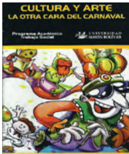
Figura 2. Portada de revista elaborada por estudiantes de primer semestre de 2012-1 del programa académico de Trabajo Social

El diálogo de los estudiantes con las diferentes realidades del contexto evocó en el acto pedagógico una situación espontánea como fue la aproximación a procesos investigativos a través de la definición de trabajos de campos grupales, desarrollando la técnica de la observación en forma espontánea y natural de las diferentes realidades sociales seleccionadas por ellos, de acuerdo con sus motivaciones y áreas de interés de la profesión (figura 3).