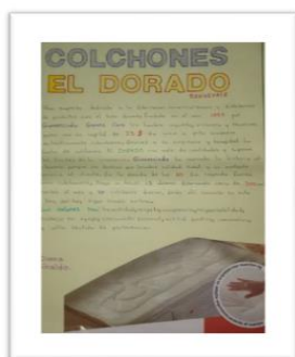
Figura 2. Problema para compartir sesión 2.