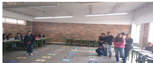
Figura 4. Escalera.